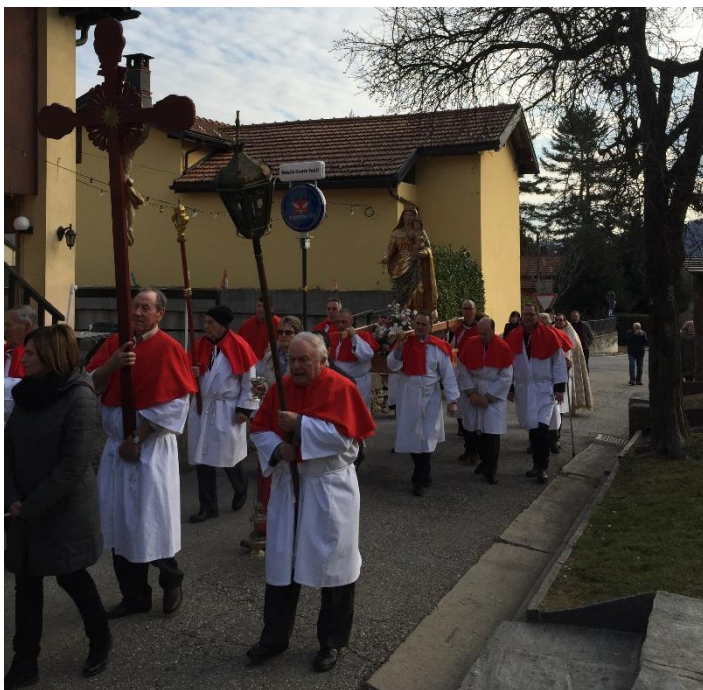
Miglieglia Confraternita del Santo Rosario e Santissimo Sacramento. 04.02.2014

Un sentito ringraziamento a coloro che hanno provveduto a queste fotografie.