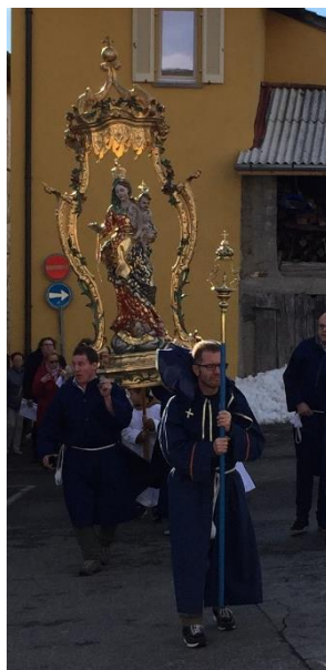
Arosio Confraternita Santo Rosario e Santissimo Sacramento. 21.01.2018