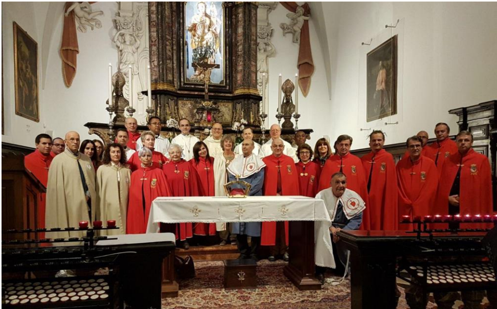
Lugano - Confraternita di San Carlo Borromeo - 04.11.2017