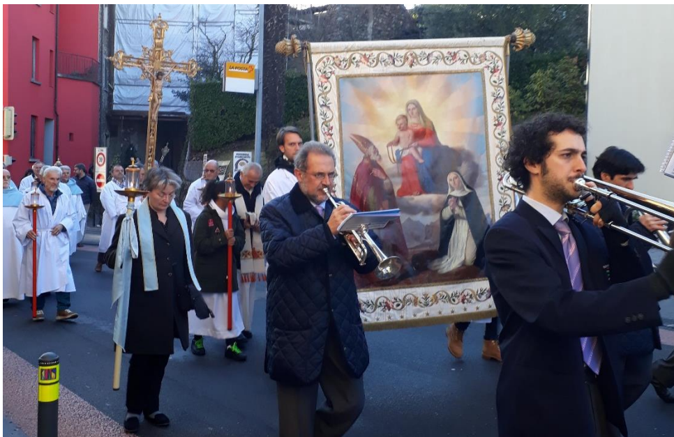
Cureglia - Confraternita Madonna della Cintura - 28.01.2018