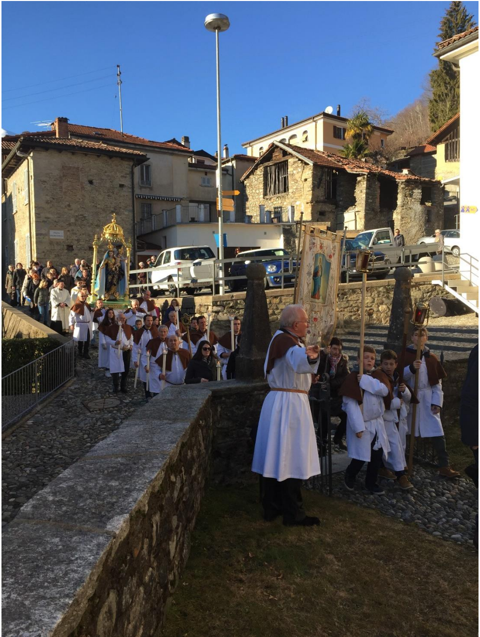
Mugena - Confraternita Beata Vergine della Cintura - 28.01.2018