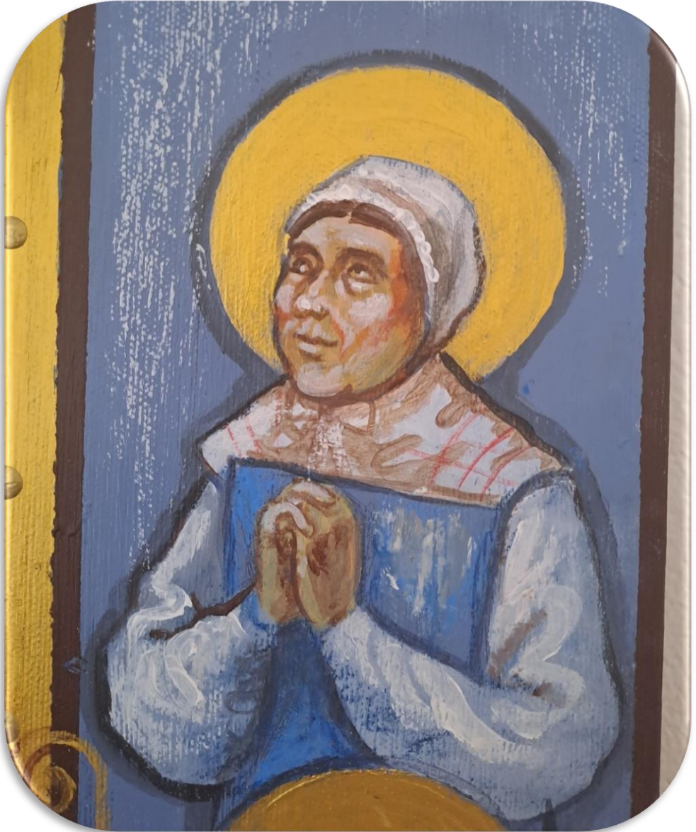
Santa Margherita Prega per noi