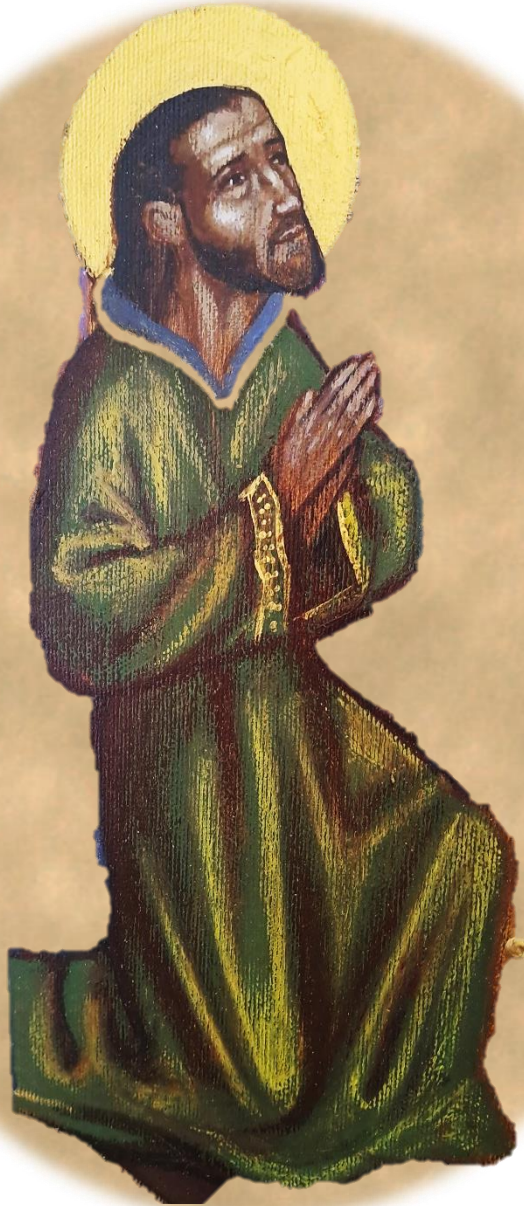
San Nicolao Prega per noi