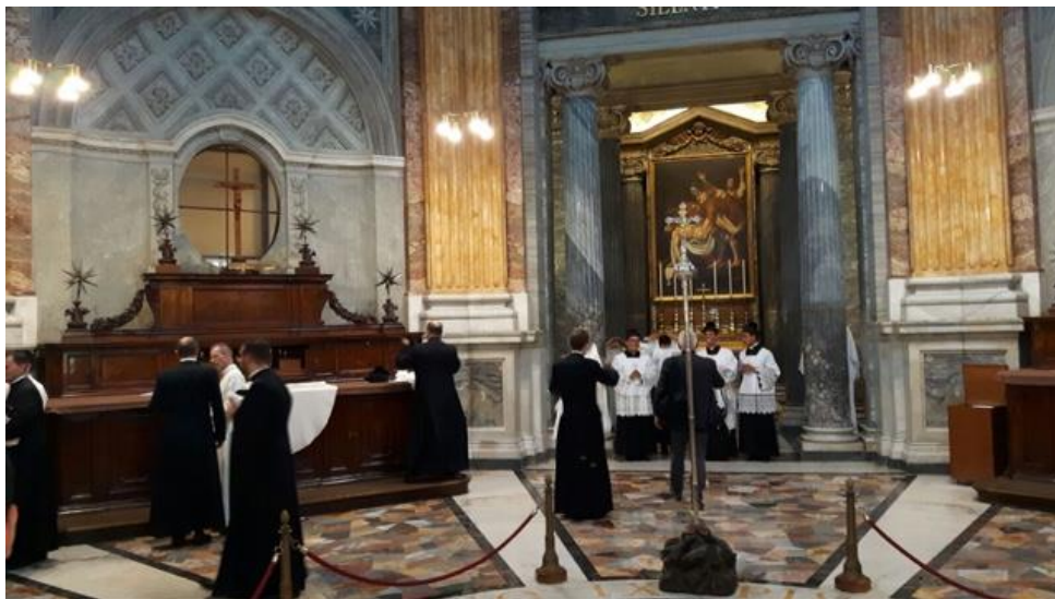
Fotografia: sacrestia della Basilica Vaticana

In generale, la sacrestia richiede un atteggiamento devoto e ordinato, coerente con la sacralità dell'intera chiesa.